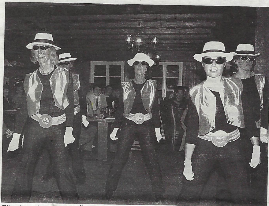
Für eine schneesichere Überraschung war der Damenturnverein Muri ...